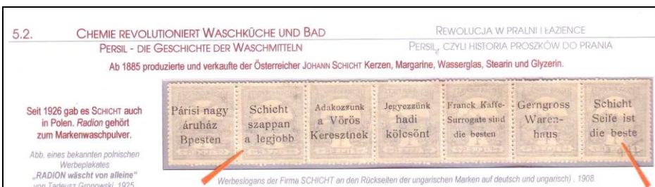
Ryc. 9. Węgierskie znaczki z nadrukami w ekspozycji autora (strzałkami wyekspozowano dwa nadruki do tematu – środki czystości).

Nieznany charakter mają nadruki na znaczkach węgierskich z 1908 r. Nie są one rejestrowane w dostępnej literaturze filatelistycznej.