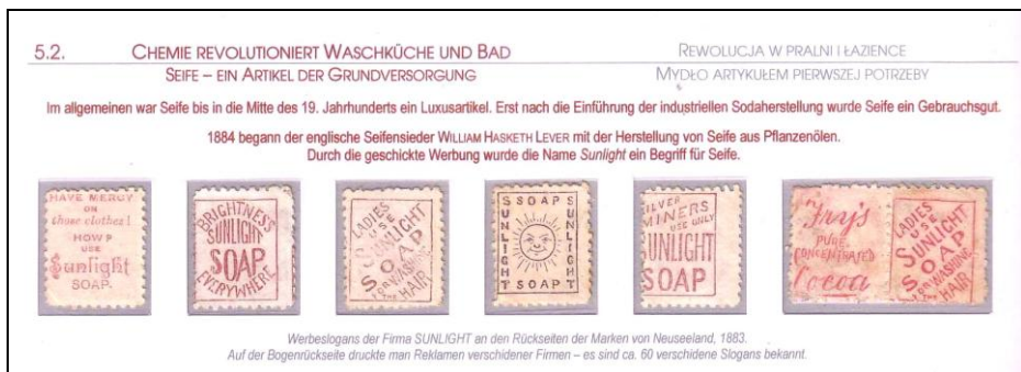
Ryc. 7. Górny fragment karty z ekspozycji „Chemia – klucz do lepszego życia” z kilkoma efektywniejszymi znaczkami Nowej Zelandii z reklamami mydła f-my Sunlight.

Z 1895 roku pochodzą także reklamy na odwrotnej stronie znaczków Salwadoru, które jednak – podobnie jak te trzy lata wcześniej w Anglii – nie uzyskały zgody administracji pocztowej na rozpowszechnianie. Znane są fragmenty arkuszy znaczków z nadrukami reklamującymi papierosy, mydło, czekoladę, lekarstwa i inne.