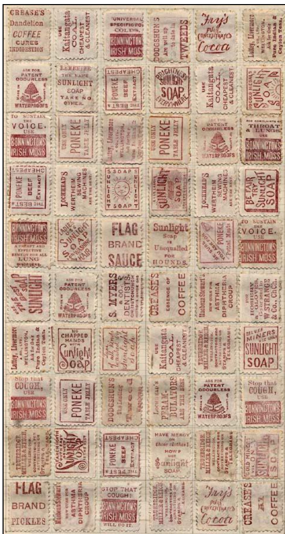
Ryc. 4. Na odwrocie znaczków Nowej Zelandii reklamowano środki czyszczące (w tym bogato produkty firmy Sunlight), ale także kakao, czekoladę, usługi medyczne i lekarstwa itd. Próba rekonstrukcji połowy arkusza.

Znaczki z nadrukami reklamowymi Nowej Zelandii mają w świecie spore grono miłośników, próbujących np. nawet zebrać kompletne arkusze z pojedynczych sztuk. Walory te są tematem opracowań książkowych.