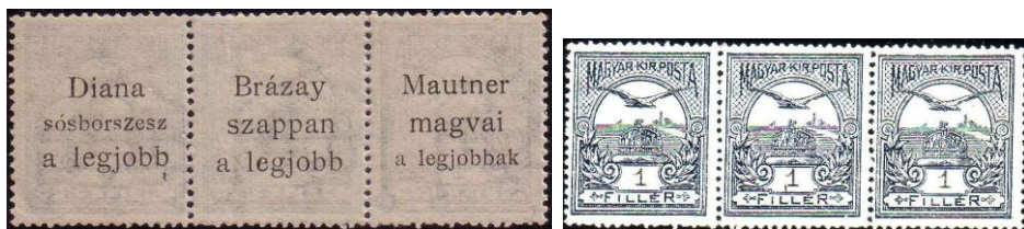
Ryc. 10. Awers i rewers węgierskich znaczków z reklamami.

Nadruki wykonane są w językach węgierskim i niemieckim (w 1908 roku Węgry były częścią Cesarstwa Austro-Węgierskiego) i zawierają hasła reklamujące mydło znanej wiedeńskiej f-my Schicht, duże budapesztskie sklepy, najlepsze nasiona lub kawę zbożową ale także zbiórkę na pożyczkę wojskową.