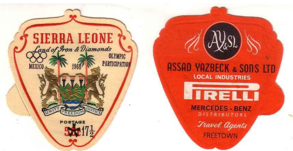
Ryc. 11. Znaczki Sierra Leone w latach 1964-1971 wydawano w fantazyjnych kształtach jako nalepki samoprzylepne (z serii Mi 427-30).

Nadruki reklamowe na odwrocie znaczków pocztowych zdarzają się obecnie rzadko. Autorowi znane są znaczki Sierra Leone z 1965 r. (z przedrukami z 1968 r.) propagujące ogumienie firmy Pirelli i salon Mercedes-Benz w Freetown, stolicy Sierra Leone. Znaczki wydano w formie samoprzylepnych nalepek z reklamami na odwrocie (część ta ulegała oderwaniu podczas użycia znaczka do opłacenia korespondencji).