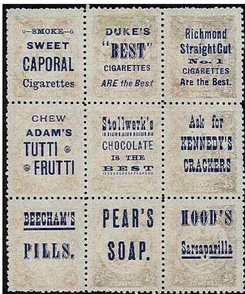
Ryc. 8. Fragment arkusza znaczków Salwadoru.

Nieznany charakter mają nadruki na znaczkach węgierskich z 1908 r. Nie są one rejestrowane w dostępnej literaturze filatelistycznej.