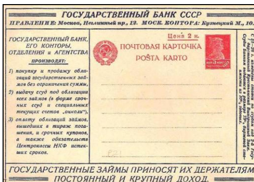
Ryc. 3. Całostka z 1926 r. z reklamą Państwowego Banku ZSRR.

Reklamy zachęcały do zakupu obuwia, mebli, książek, artykułów elektrycznych, zabawek, papierosów itd. oraz do korzystania z usług Państwowego Banku ZSRR. W 1926 r. wydano 22 całostki tego rodzaju (wszystkie.), w nakładach od 25 tys. do 200 tysięcy egzemplarzy. Napis „Kartka pocztowa” był wydrukowany po rosyjsku i w języku esperanto.