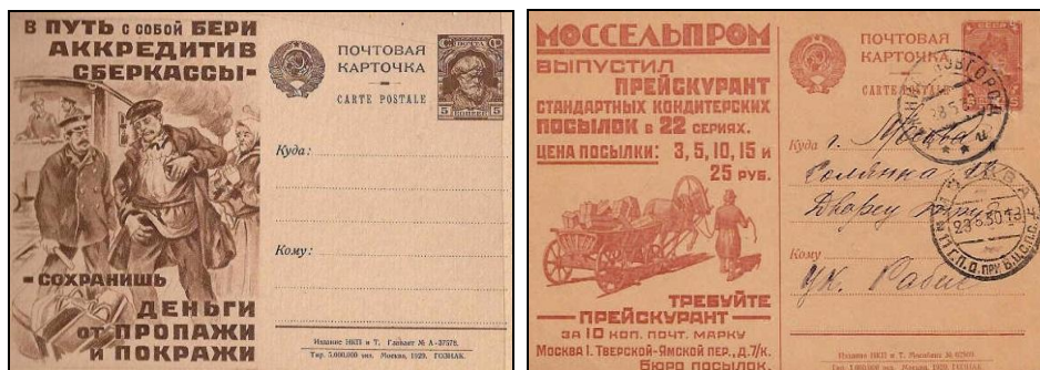
Ryc. 4-5. Reklamowo-agitacyjne kartki pocztowe o różnorodnej tematyce.

Nieco innym rodzajem walorów, choć o podobnym charakterze jak reklamowe kartki pocztowe, były reklamowo-agitacyjne kartki pocztowe. W latach 1927-1934 wprowadzono do obiegu aż 305 rodzajów takich całostek. Poza pierwszą kartką pocztową tego typu, wydaną w 1927 r., mającą napisy na obwodzie strony adresowej oraz w lewej jej części (w kolorze ceglasto-czerwonym), kolejne kartki miały rysunki i napisy agitacyjne tylko na lewej połowie strony adresowej. Całostki te były drukowane w kolorach: brązowym, czerwonym, niebieskim, czerwono-brązowym lub pomarańczowo-czerwonym. Ich strona korespondencyjna nie była zadrukowana, a nakład wynosił od 50 tysięcy do 10 milionów egzemplarzy.