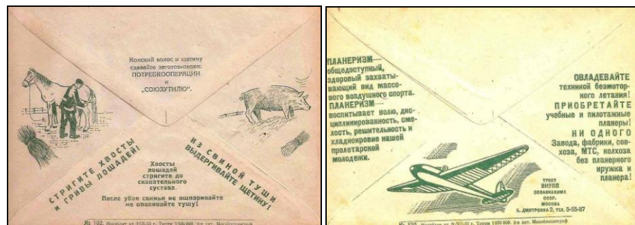
Рyc. 8-11. Reklamowo-agitacyjne koperty z reklamą на rewersie.