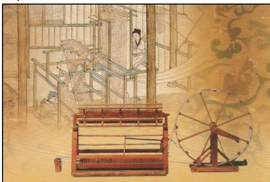
Ryc. 2a-c. Tkaniny jedwabne – tkanie i barwienie.

Na specjalną uwagę zasługują karty (całostki) loteryjne. Są wydawane od 1.12.1991 r. z okazji zbliżającego się wówczas Roku Mały. Karty te, z wydrukowanym znaczkiem opłaty krajowej, sprzedawane są z narzutem za udział w loterii noworocznej. Zwyczajowo wysyłane są razem z kuponem uprawniającym adresata do udziału w losowaniu, które odbywa się – pod nadzorem Min. Finansów – w ostatni dzień świąt chińskiego Nowego Roku. Wygrane w wysokości 5000 juanów (ok. 3000 zł) można odebrać w miejscowych urzędach pocztowych. Rozprowadzane są tzw. karty krajowe i regionalne. Karty krajowe są dostępne we wszystkich urzędach pocztowych i od 1996 r. mają na stronie ilustrowanej także adnotacje z kodem cyfrowo-literowym, który nieznacznie różni się od powyżej opisywanego (<rok wydania> <agencja> <loteria noworoczna> <numer ilustracji lub serii>). Czasami numer agencji przedstawiany jest za pomocą chińskiego znaku (jak poniżej).