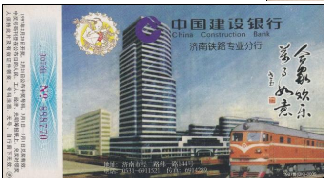
Ryc. 3a-c. Budynek China Construction Bank, lokomotywa spalinowa.