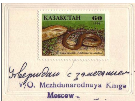
Ryc. 6 i 7. Egzemplarz w przygotowanej wersji i po nagłej zmianie waluty.

W działalności MK zdarzały się różne, nieprzewidziane przypadki. W 1994 r. przygotowano serię znaczków „Fauna” dla Kazachstanu.