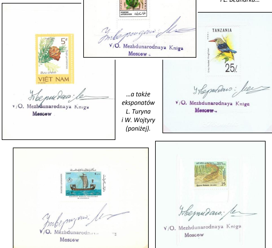
Ryc. 1-5. Walory z ekspонатów W. Andreyuka, W. Dobrowolskiego i L. Bednarka...

...a także ekspонатów L. Turyna i W. Wojtyry (poniżej).