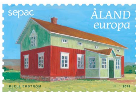
Ryc. 3. Znaczek Wysp Alandzkich z 2019 r. To nie jest znaczek z cyklu EUROPA. Napis ten oznacza nominat dla przesyłek do krajów europejskich.

Corocznie ukazuje się atrakcyjny folder, w którym znajdują się w przezroczystych hawidach wszystkie znaczki wydane w danym roku z logo organizacji, wraz ze szczegółowym ich opisem oraz atrakcyjnymi ilustracjami. Na okładce folderu widzimy również barwy narodowe krajów i terytoriów, które w danym roku wydały takie znaczki. Foldery są do kupienia na oficjalnych stronach internetowych członków organizacji lub na portalach aukcyjnych. Dostępne są również zestawy znaczków z logo SEPAC, wydane przez poszczególnych emitentów w trakcie funkcjonowania organizacji.