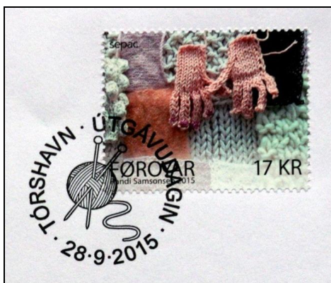
Ryc. 14 i 15. Także stemple okolicznościowe FDC dla wydań wielu krajów są interesującym materiałem filatelistycznym dla tematyków (stemple z Monaco z 2013 r. i Wysp Owczych z 2015 r.).