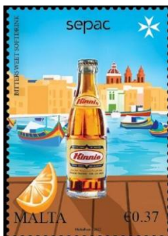
Ryc. 2. Tylko pierwszy znaczek (z 4-znaczkowej serii Malty) z 2022 r. nosi napis SEPAC.

Niektóre kraje wydają jeden znaczek z wybranym tematem, umieszczając na nim logo, inne emitują kilku znaczkowe serie. W tym drugim przypadku tylko jeden znaczek z serii opatrzone jest napisem SEPAC.