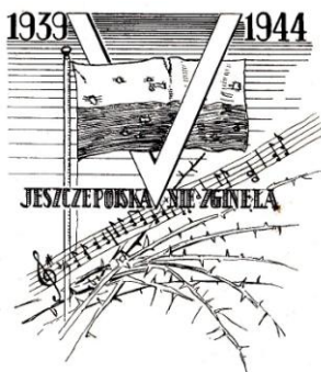
6. Piąta rocznica wybuchu wojny (przestrzelona polska flaga, nuty hymnu, znak zwycięstwa). (nakład 250 egz.)