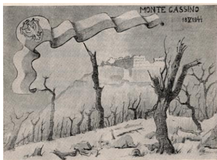
3. Monte Cassino (klasztor i zniszczone drzewa). (brak danych)