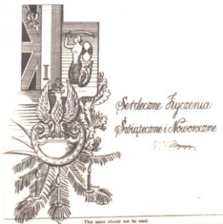
10. Jak nr 9; dodatkowo życzenia bożonarodzeniowe oraz noworoczne. (nakład 650 egz.)