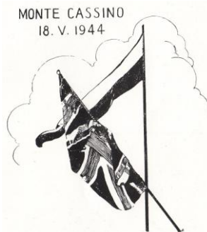
4. Monte Cassino (flaga polska i brytyjska). (nakład 300 egz.)