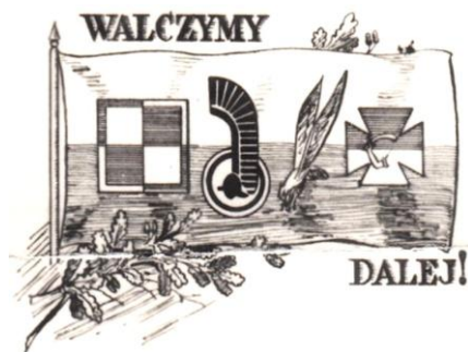
5. Odznaki polskich formacji wojskowych na tle polskiej flagi, napis: WALCZYMY DALEJ! (nakład 250 egz.)