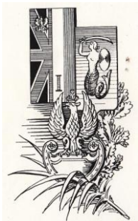
9. Odznaka Kwatery Głównej 1. i 2. Korpusu oraz syrenka i orzeł. (nakład 250 egz.)