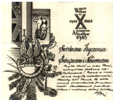
10a. Jak nr 10; dodatkowo życzenia bożonarodzeniowe oraz noworoczne dwujęzyczne (polsko-angielskie). (nakład 100 egz.)