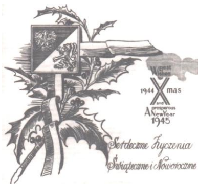
7. Odznaka dowództwa polskich jednostek w Wlk. Brytanii, ozdoby, orzeł, życzenia bożonarodzeniowe oraz noworoczne. (nakład 200 / 100 egz.)