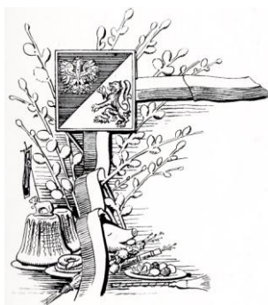
8. Zmodyfikowany nr 7, z okazji świąt wielkanocnych. (nakład 300 egz.)