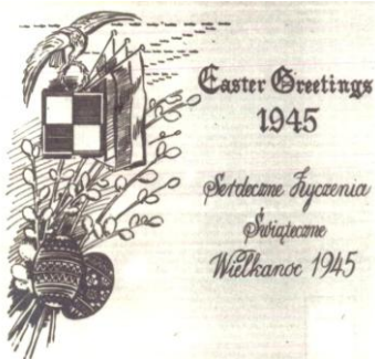
13. Zmodyfikowany nr 12, życzenia wielkanocne dwujęzyczne (polsko-angielskie). (nakład 300 egz.)