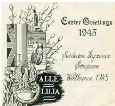
11. Zmodyfikowany nr 9; życzenia wielkanocne dwujęzyczne (polsko-angielskie). (nakład 300 egz.)