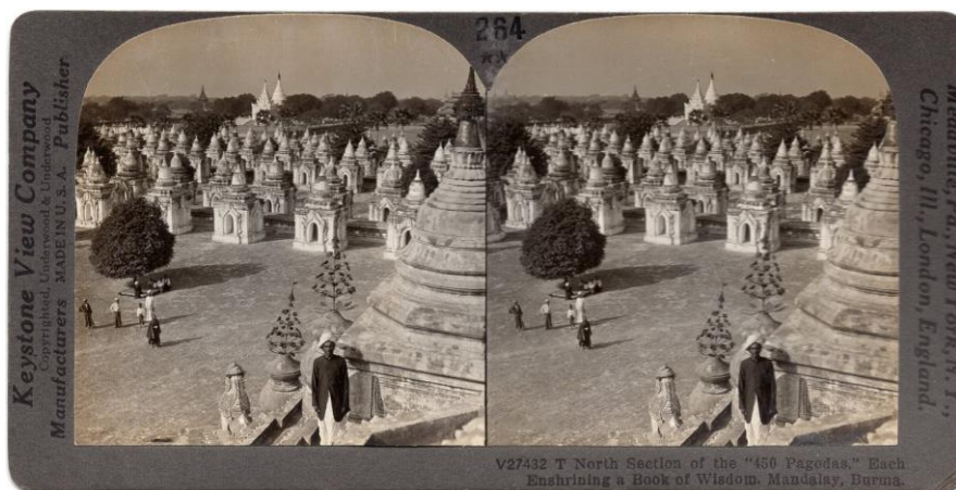
Ryc. 4. Pagoda Kuthodaw znana jest jako największa na świecie księga w Mandalay (Birma). Złota świątynia otoczona jest 729 białymi kamiennymi stupami, zawierającymi marmurowe płyty, na których są wyryte teksty z Tipitaki (święte pisma buddyjskie).

Na portalach aukcyjnych można znaleźć wiele ofert sprzedaży zdjęć stereoskopowych. Na portalu www.allegro.pl , po wpisaniu w wyszukiwarkę słów: zdjęcia stereoskopowe , pojawiają się oferty zdjęć europejskich miast, polskich gór czy zdjęć z okresu II wojny światowej. Na równie popularnych portalach aukcyjnych www.ebay.com lub www.delcampe.net , po wpisaniu słowa: stereoskopie , wyświetli się wiele ofert, które można wykorzystać do różnorodnych tematów eksponatów.