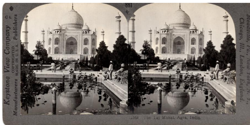
Ryc. 3. Świątynia miłości w Tadz Mahal, Indie.