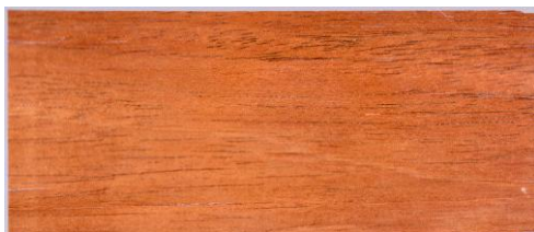
Ryc. 9. Fornir z hiszpańskiego drzewa cedrowego o grubości 1 mm pochodzący z metalowej tuby.

Wolor ten może być również wykorzystany w ekspozycie o drzewach lub dizajnie.