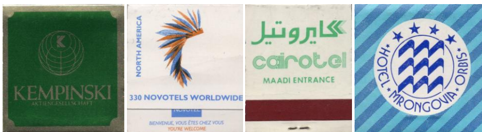
Ryc. 2. Zapałki książeczkowe z reklamami z branży hotelarskiej.

W grupie zapałek książeczkowych dominującą pozycję mają wydania okazjonalne i reklamowe, związane przede wszystkim z branżą turystyczną, gastronomiczną, producentów używek (alkohole, papierosy) i inne.