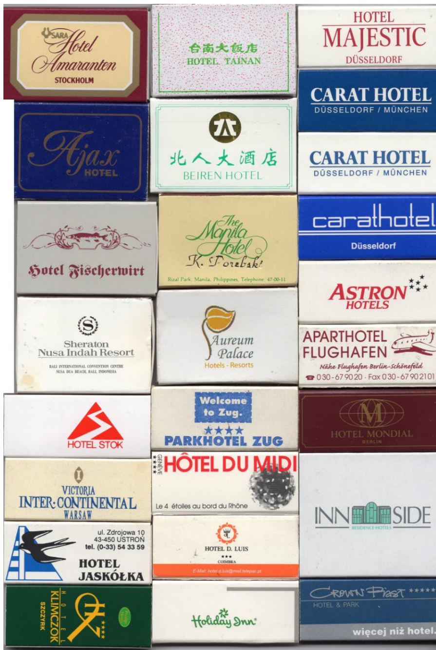
Ryc. 3. Pudełka od zapatek – reklamy z branży hotelarskiej.