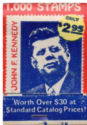
Ryc. 6. Wykorzystanie wizerunku znanej postaci ze świata polityki.

Kolejnym, interesującym walorem związanym z branżą tytoniową są opaski z cygar.